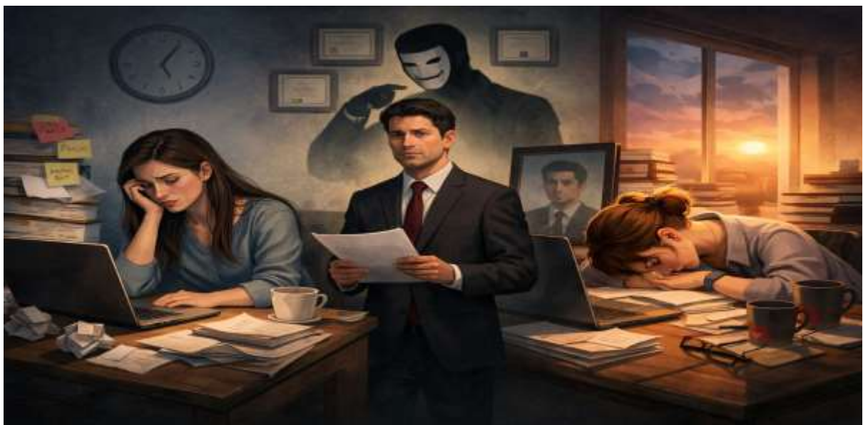
Ilustração dos casos que serão descritos a seguir.